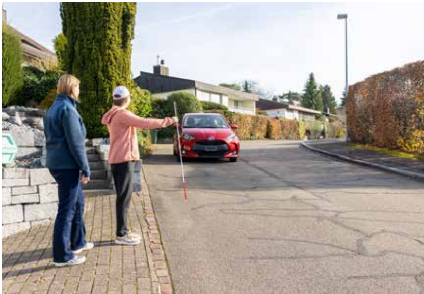
Achtung sehbehinderte Person! Wird der weisse Stock angehoben, müssen Autofahrer anhalten.