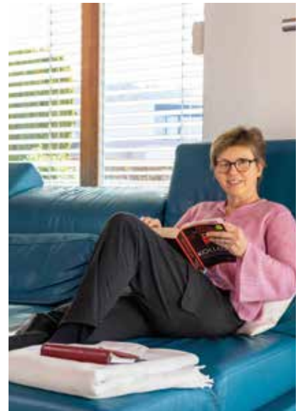
Lesen geht auch mit nur einem Auge, wenn man die richtige Technik kennt.

telefonieren und SMS schreiben kann sie nun per Sprachbefehl steuern.